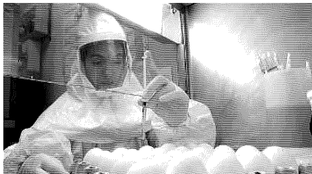
Controlli. La commissione arriva direttamente da Bruxelles