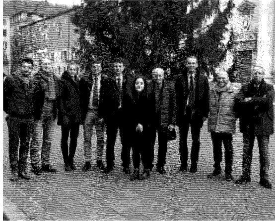
I candidati della lista «Comunità e territorio» per la Provincia